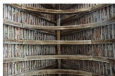
Saint Benoit des Ombres