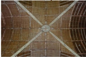
Doudeauville en Vexin