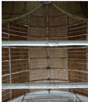
Doudeauville en Vexin