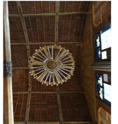
Doudeauville en Ve