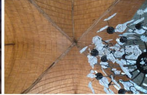
La Neuve Grange